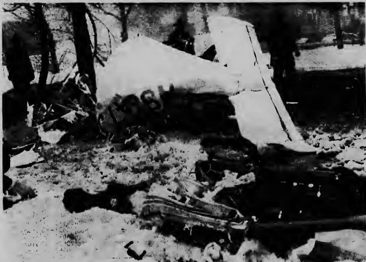
Miembronan di brandweer y polisnan aki ta inspeccionando loke a sobra di un avioneta di un motor cu aparentemente a perde caminda den neblina y a bai dal den un edificio na Chicago pa despues cai na terra algun cien meter mas aleuw. E piloto y su pasahero tur dos a muri